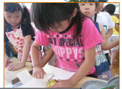
カレー作りも真剣