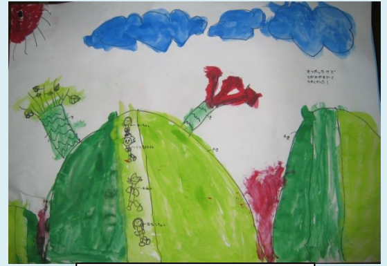
年長さんの山登りの絵

自然の中で、子どもたちの感性を刺激し 自分らしさを見つけ、周りの仲間を思いやり、 たくましく活動する子どもたちになってほしいと願っています。