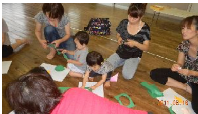
親子であじさい を作りました。

「ぽっかぽか」では、子育てをする中で、いろんなことにお悩み、こんな時はどうしたらいいの?と、親同士で話し合う”子育てトーク”を行いました。初めての子育てのお母さんから、2, 3人とまさに子育ての真っ最中のお母さん達と、一緒に悩みを出し合うことができました。意見やアドバイスも出て、思いが1つになるひとときでした。私達(親)は、子ども達によって学ばされることを改めて実感することができました。子育ては大変なものです。「大変」…自分のやってきたことは、いつか必ず大きく変化をもたらすと思います。悩みが楽しさ変わっていくといいですね(^_^)v