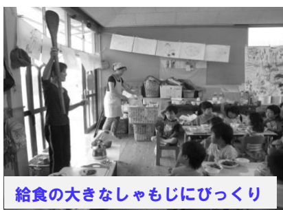
給食の大きなしゃもじにびっくり

第2回目の食育は、年中さんに給食のメニューにあるヨーグルトについてお話をしました。「ヨーグルトは何で出来ているから分かる?」との問いに以外に「牛乳!」とたくさんの言葉がきかれました。さすが、年中さん!!「じゃあ、牛乳はどこからくるの?」とまたまた質問すると、1人の子どもが「あのね、うしのおっぱいからだよ!」と答えてくれました。そこで、牛の親子の写真や搾乳の様子の写真を見ながら、牛のお母さんが赤ちゃんを産んだらおっぱいが出る事や、牛の赤ちゃんはお母さんのおっぱいではなく粉ミルクを飲んで大きくなることを知りました。(実は、私も初めて知りました。)「皆も赤ちゃんの頃ママのおっぱいやミルクを飲んで大きくなったでしょ?牛の赤ちゃんも本当はママのおっぱい飲んでたいけど飲めないんだよ」「えっ!何で?」「かわいそう」「だって、皆が大きくなる為に皆の牛乳になってお店にあるでしょ?だから、牛さんにありがとうって思うと牛さんも嬉しいかもしれないね」というような会話をあり、真剣な眼差しで話を聞いていた子どもたちです。