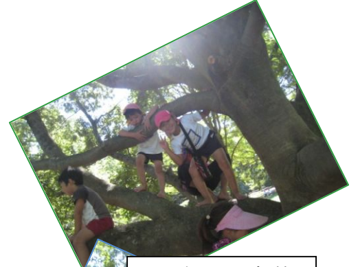
昼は立田山に探検